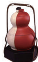
《白陶朱漆組合せ瓢成り弁当》 個人蔵