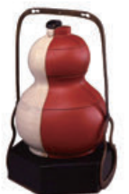
《白陶朱漆組合せ瓢成り弁当》 個人蔵